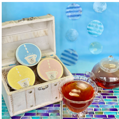
夏は爽やかフレーバー派

夏の暑い日には香り高いフレーバードティーをアイスティーで。トッピングにフルーツを添えて、爽やかなティータイムを。