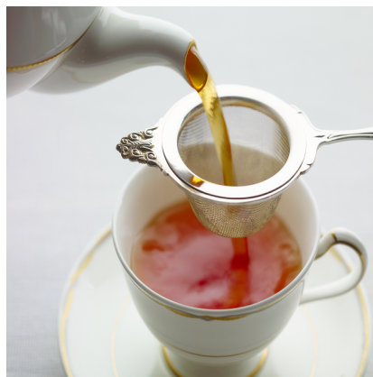
夏でも本格ストレート派

夏の暑い日には香り高いフレーバードティーをアイスティーで。トッピングにフルーツを添えて、爽やかなティータイムを。